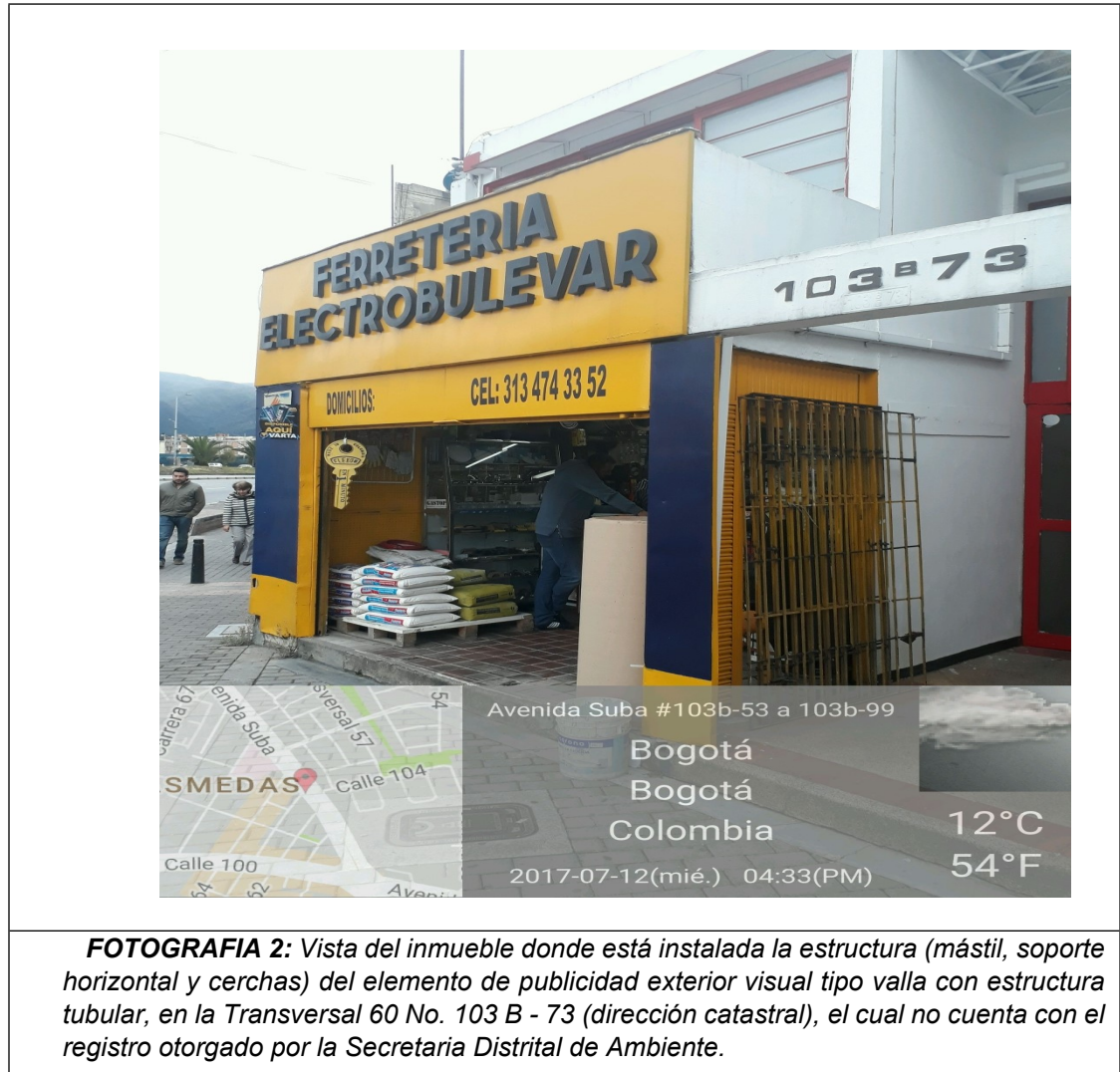
FOTOGRAFIA 2: Vista del inmueble donde está instalada la estructura (mástil, soporte horizontal y cerchas) del elemento de publicidad exterior visual tipo valla con estructura tubular, en la Transversal 60 No. 103 B - 73 (dirección catastral), el cual no cuenta con el registro otorgado por la Secretaría Distrital de Ambiente.

ALCALDÍA MAYOR DE BOGOTÁ D.C. SECRETARÍA DE AMBIENTE